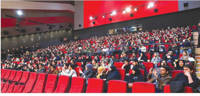
سیداکران نتوانسته «فروردین» را شروع ببرد

همچنین، اسامی مقتضیان پس از تصویب، در مرحله دو مرحله‌ای اول و دوم هر ماه به شرکت توسعه تجارت و فناوری «نار» اطلاع داده شده و اعتبار مودر نظر، حداکثر ظرف ۲۸ ساعت پس از تأیید، در کیف پول الکترونیکی افراد در اپلیکیشن «نار» شارژ خواهد شد. شرکت جهان اندیشان اکام، به شرکت‌نامه و در مجموع صورت‌جلسه اعتباری هنر، در ابتدا با نام هنر کارت بنیان ایرانیان، «هنر کارت» فعالیت خود را شروع کرد. در سال ۱۴۰۲ با گذرشتن فعالیت شرکت از «هنر کارت» نام آن به «جهان اندیشان اکام» با نام تجاری «مکارت» تغییر یافت. در حال حاضر این شرکت در زمینه ارائه خدمات رفاهی به هنرمندان دارای هنر کارت و دیگر دارندگان کارت های این شرکت مشغول فعالیت است.