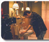
امروز هست خواهد شد.

است. مثلاً در هشت سال دفاع مقدس بمباران‌های شیمیایی در وسعتی که به کار می‌رفت نشانخته بود. ۱۰۰ هزار مجروح شیمیایی داشتیم و کادر درمان باید با این پدیده‌ها مواجه می‌شد. سخت‌ترین چیزی که در این دوران کرونا بود، این بیماری نشان‌دهنده و هنوز ما تا حدودی نشان‌دهنده است و پرستاران و کادر درمانی با این شرایط مواجه می‌شوند. ایران در مقابل آن قرار گرفته‌اند. ویروس شایع دیگر این دو دوره از حجم کاری در دوره‌های خاصی از هر دو دوره دانست و افزود: جنگ ۸ سال طول کشید که در دوره خاصی برای پرستاران بود. تمام عملیات پزشکی ۵۰ تا ۴۰ ساعت طولانی تر هم بود. حدود ۷۰۰ هزار نفر مجروح عملیات داشتیم. این دوره طولانی با این حجم عظیم از مجروحان طبعا فشار مضاعف و سازمان به وجود می‌آید. کادر درمانی و پرستاران به وجود می‌آید. در دوره کرونا هم شاهد این شهادت هستیم. موج اول، دوم و موج سوم. موج هالی که وقتی پدید می‌آید طبعا کادر درمانی کمر می‌زنند. پرستاران را زحمت مضاعف و سختی‌های فراوان همراه می‌کند.