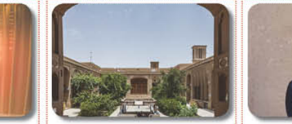
امروز هست خواهد شد.

وی افزود: ما همین نگاه ما می‌توانیم حوزه مسئله فرهنگ را در روابط بین‌الملل دنبال کنیم. هر چه زمان می‌گذرد، بر اهمیت این عنصر افزوده می‌شود. یک طرف گسترش تکنولوژی‌های ارتباطی به هر میزانی که افزایش پیدا می‌کند، شرایط نفوذ و تأثیرگذاری فرهنگ در ارتباطات بین‌الملل را بالاتر می‌برد و از آنجایی که تکنولوژی‌های ارتباطی رابطه به لحظه و آن به آن در حال توسعه هستند، بنابراین چشم‌انداز شایع‌های آینده روابط بین‌الملل همین خواهد بود که فرهنگ بر اهمیت تر از آنچه امروز هست خواهد شد.